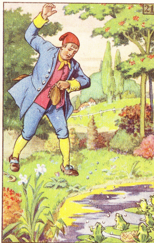
Wierp hij hun al de zilverstukjes toe.

„Zoo,” riep de boer boos, „willen jullie het toch beter weten dan ik, tel ze dan zelf,” en hij gooide het geld midden in de vijver. Toen bleef hij staan wachten tot de kikkers hun ongelijk zouden erkennen en hem zijn rijksdaalders zouden terug-